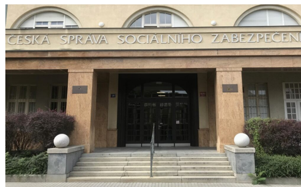
Ústředí České správy sociálního zabezpečení (ČSSZ).

Více než 100 tisíc Čechů pobírá důchod, ale trvale žijí v zahraničí. Výplaty důchodů do cizích zemí mají specifická pravidla a je nutné pravidelně dokládat takzvané potvrzení o žití. Od roku 2026 se povinnosti zmírní a například lidé žijící na Slovensku už nebudou muset potvrzení dokládat vůbec.